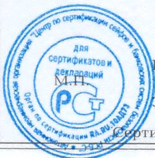
Схема сертификации - 1с